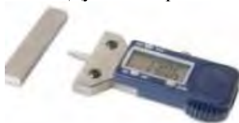
Дигитални уређај за мерење дубине шаре